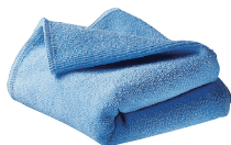
Varenr.: 1849129 Mikrofiberklut for alle overflater. Etterlater ingen striper.