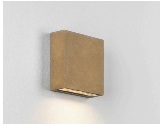
CODE: 1331012 FINISH: SOLID BRASS

THIS PRODUCT IS NOT SUITABLE FOR INSTALLATION WITHIN FIVE MILES OF THE COAST. FOR THESE ENVIRONMENTS, PLEASE FILTER PRODUCTS ON THE ASTRO WEBSITE BY 'COASTAL'.