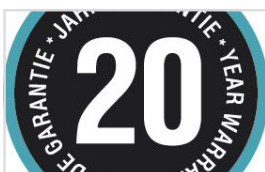
HØY KVALITET FOR LANG VARIGHET