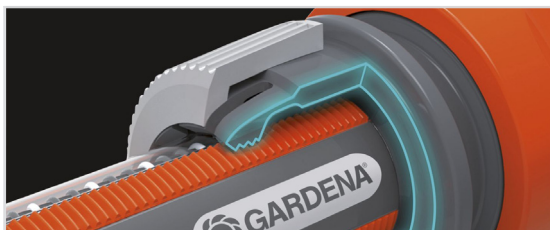
MED POWER GRIP-PROFIL