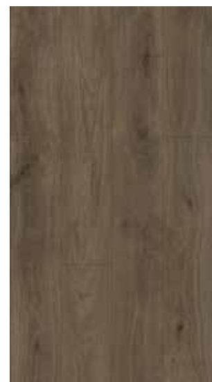
etna dark brown 62001988 nobb.57166824