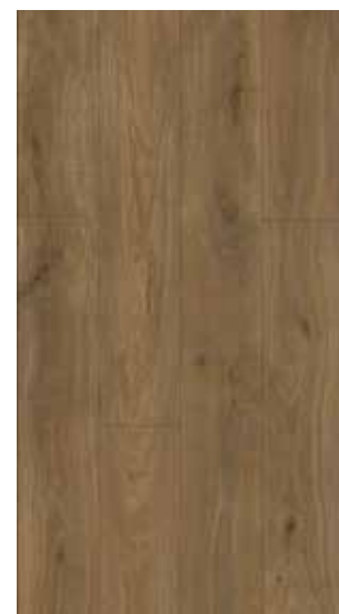
etna brown 62001987 nobb. 57166813