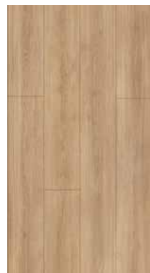
katla natural light 62001989 nobb. 57166832