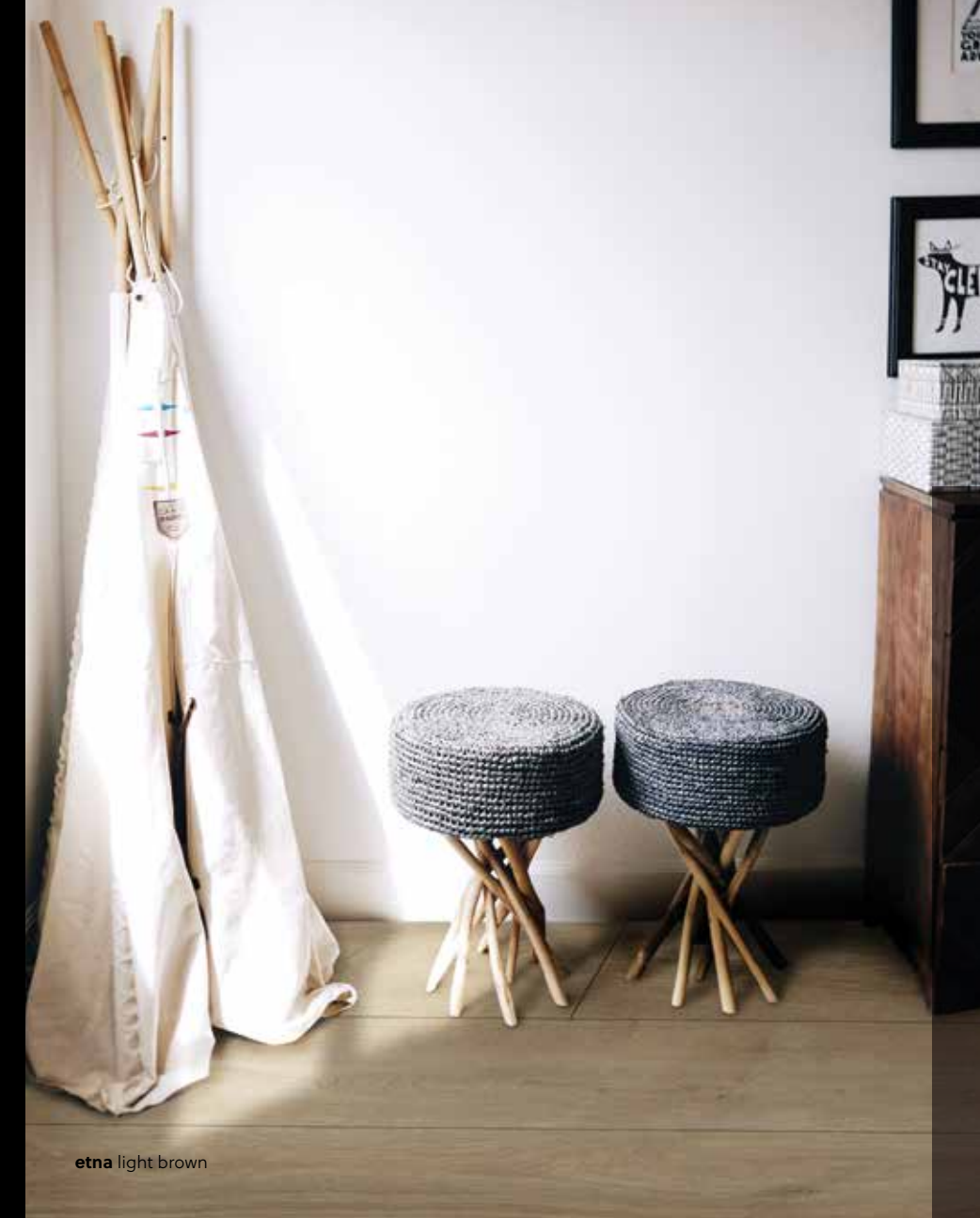
etna light brown

Grand Majestic er designet og produsert i Norge og representerer den siste utviklingen innen den progressive teknologien til BerryAlloc® høytrykkslaminat. Grand Majestic er en sammensmeltning av trendsettende estetikk med høy ytelse og er toppen av vår HPL-innovasjon: verdens sterkeste laminatgulv i en planke med ekstraordinære dimensjoner som fremdeles er lett å installere og enkel å ta vare på.