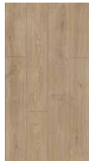
etna light brown 62001986 nobb. 57166805