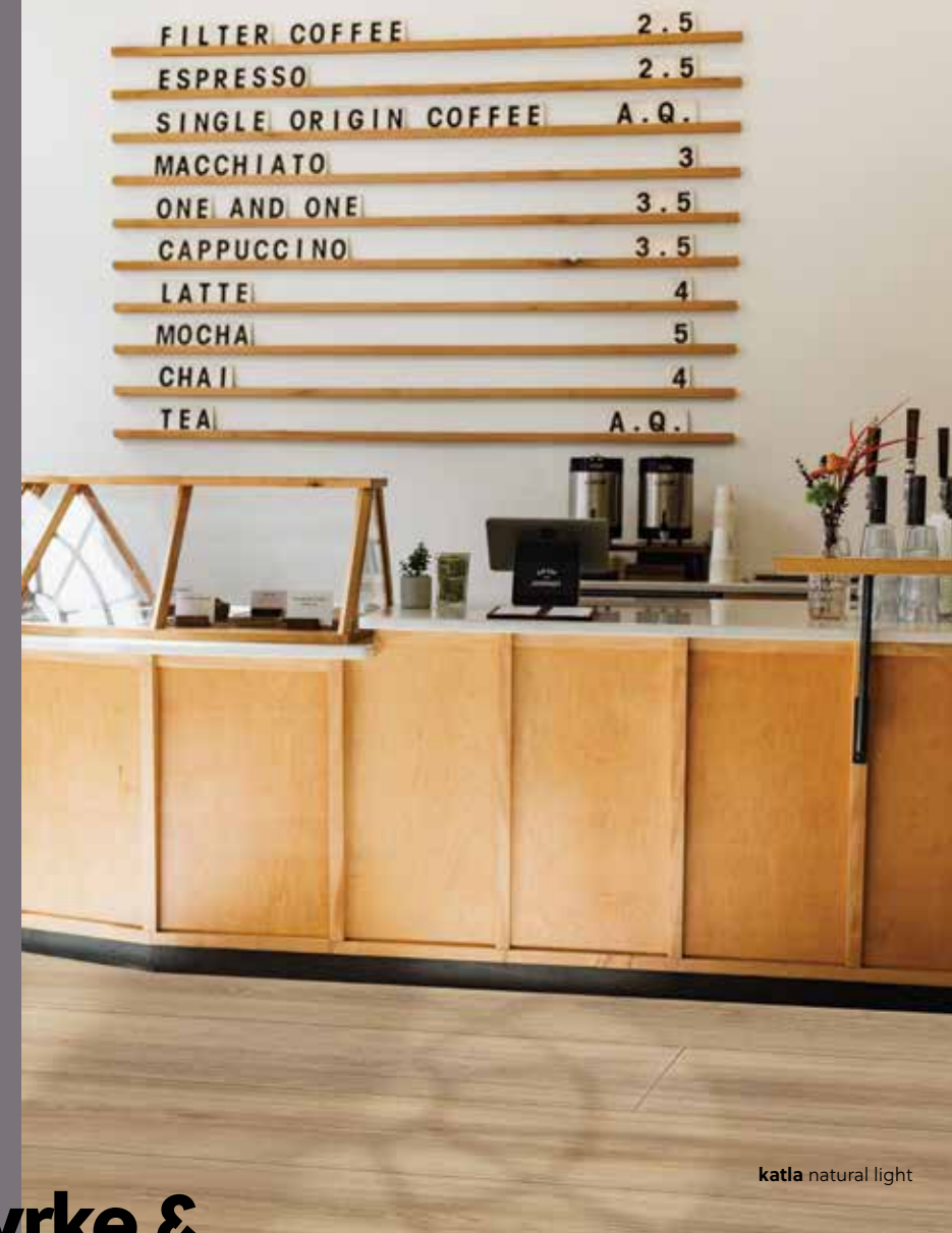
katla natural light