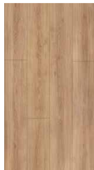
katla natural honey 62001991 nobb. 57166858