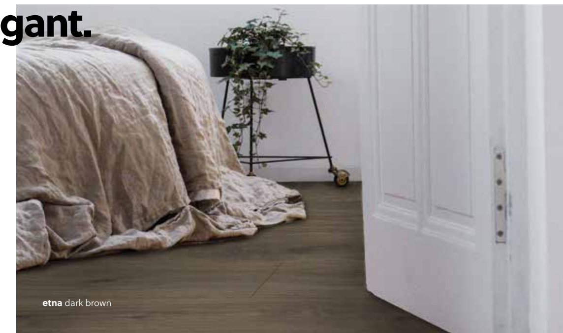
etna dark brown

Med tidløse og elegante tredekorer fanger Grand Majestic den beroligende kraften i naturen. Et gulv som kan takle alt livet byr på.